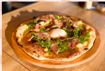
満月たまごと生ハムサラダ 1650えん