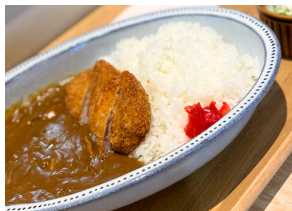
ひれかつカレー 1100えん