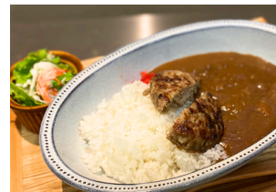
ハンバーグカレー 1000えん