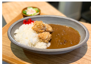
からあげカレー 1050えん