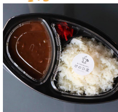
キホンノカレー 850えん