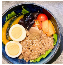
和風豚ひき丼 1000えん