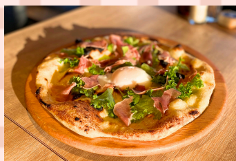
満月たまごと生ハムサラダ 1650えん