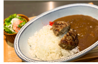
ハンバーグカレー 1000えん