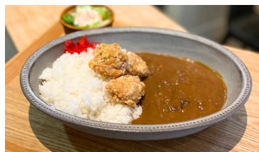
からあげカレー 1050えん