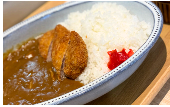
ひれかつカレー 1100えん