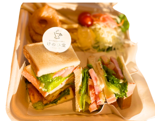
BLTCサンド (温) お得セット 1200えん 単品 900えん