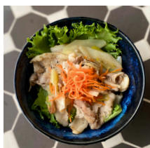
レモンペッパー豚丼 1000えん