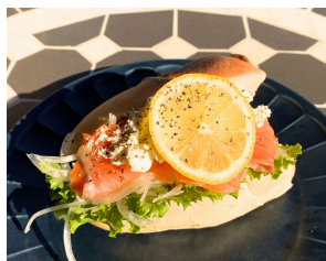
サーモン&クリームチーズ (温) お得セット 1200えん 単品 900えん