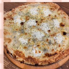
チーズ (メイフル付) 1650えん