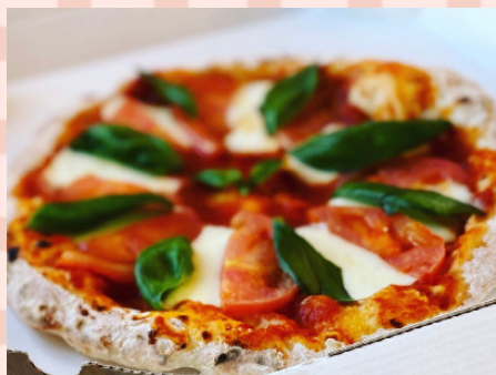
マルゲリータ 1650えん

☀️ ☕ コーヒー (H/I) ☕ 和紅茶 (H/I) ☕ オレンジJ ☕ りんごJ