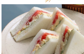
ミックス (冷) 750えん