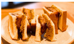
ヒレカツ (温) 900えん