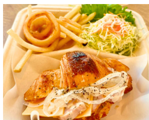
バジルチーズパテの クロワッサンサンド (温) お得セット 1350えん 単品 1000えん