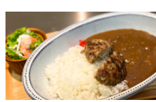
ハンバーグカレー 1250えん