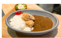
からあげカレー 1250えん