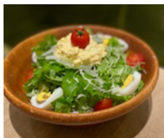
けのひサラダ 650えん シーザーサラダ 700えん