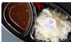
キホンノカレー 1000えん