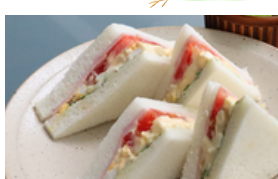
ミックス (冷) 800えん