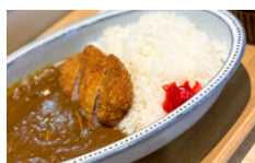
ひれかつカレー 1300えん