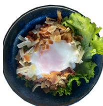
チリトマト丼 1150えん