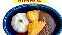
勝つ魚 (かつお) カツカレー 1250えん