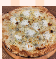
チーズ (メイプル付)