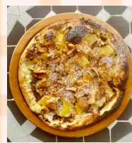
アップルシナモン