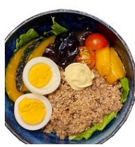
和風豚ひき丼 1150えん