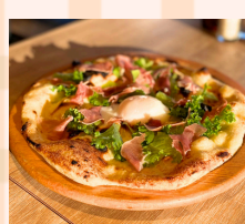
満月たまご生ハムサラダ