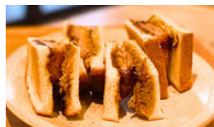
ヒレカツ (温) 1000えん