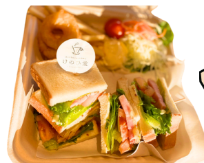
BLTCサンド (温) お得セット 1350えん 単品 1000えん