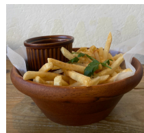
フライドポテト 550えん オニオンリング 650えん ケチャップ+30えん