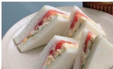
ミックス (冷) 800えん