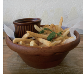
フライドポテト 550えん オニオンリング 650えん ケチャップ+30えん