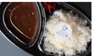
キホンノカレー 1000えん