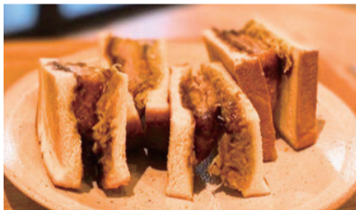
ヒレカツ (温) 1000えん