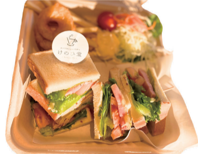
BLTCサンド (温) お得セット 1350えん 単品 1000えん