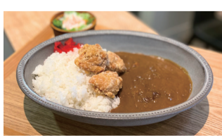
からあげカレー 1250えん