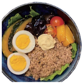
和風豚そば丼 1150えん