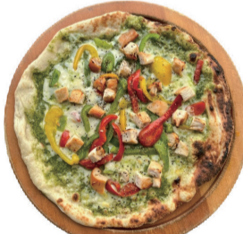
チキンジェノベーゼ