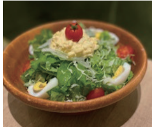
けのひサラダ 650えん シーザーサラダ 700えん