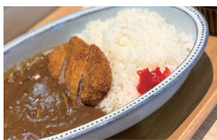
ひれかつカレー 1300えん