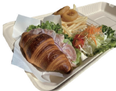
ローストポーク柚子胡椒ソースの クロワッサンサンド (温) お得セット 1350えん 単品 1000えん