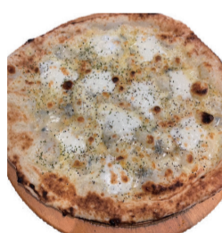
チーズ (メイフル付)