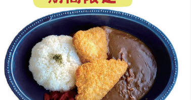
勝つ魚 (かつお) カツカレー 1250えん