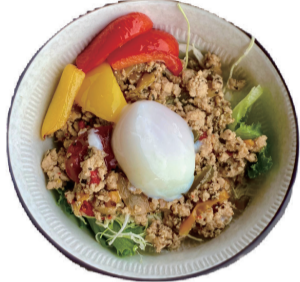
けのひ風ガパオライス 1150えん